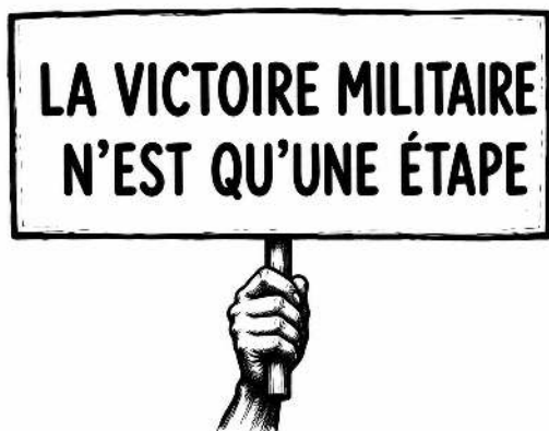
Illustration : Terres Mouvantes

Le précédent ne dit pas à Bamako de négocier demain avec Ag Ghaly, et il a un revers lourd : la paix algérienne s'est payée d'une amnistie qui a effacé les comptes, enterré la justice pour des milliers de disparus, protégé des bourreaux. Voilà ce qu'une sortie coûte aussi. Mais il montre ce que la prime, seule, ne dit pas. La force ouvre une fenêtre ; encore faut-il savoir quoi y construire.