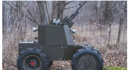
Été 2025 : robot de combat terrestre ukrainien. La technologie a atteint Gao avant l'annonce de Zelensky.

Le savoir-faire a traversé sans visa. Personne ne l'a déclaré en douane.