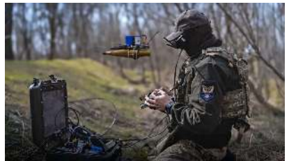
Ministère de la Défense ukrainien