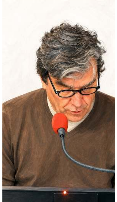
8 mai, 7 h 15 : la chronique qui a forcé Paris à choisir entre démentir et se taire.